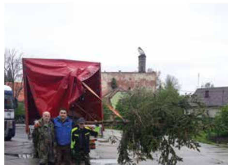
Májka už je v Mořicích