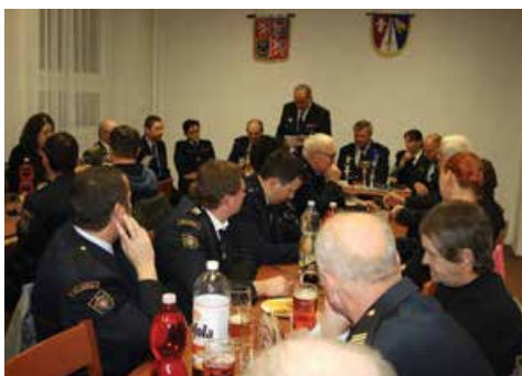
Valná hromada SDH