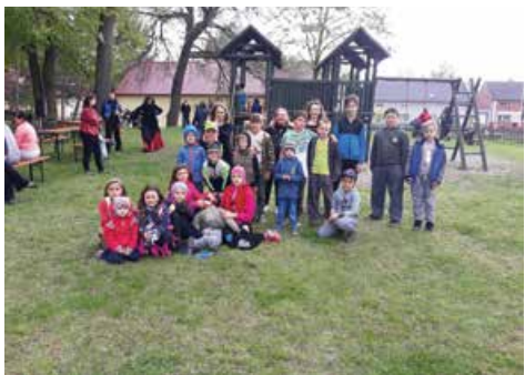
Čarodky na kopci