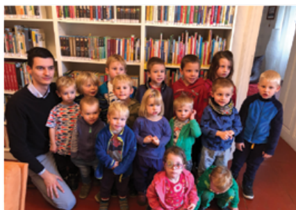
Návštěva dětí z mateřské školy