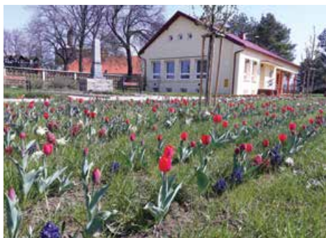
Jaro u pomníku