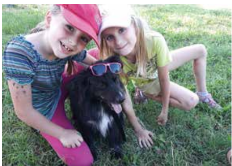
Obecní Ben s holkama