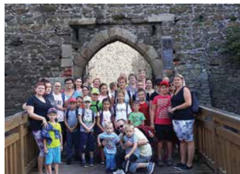
Výlet na Helfštyjn