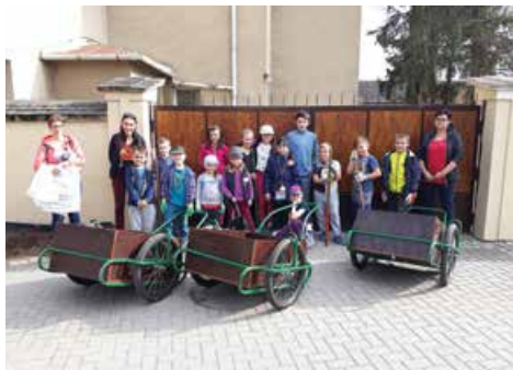
Uklidme Česko, celá parta