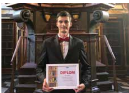
Vyhlášení soutěže Knihovna roku 2018